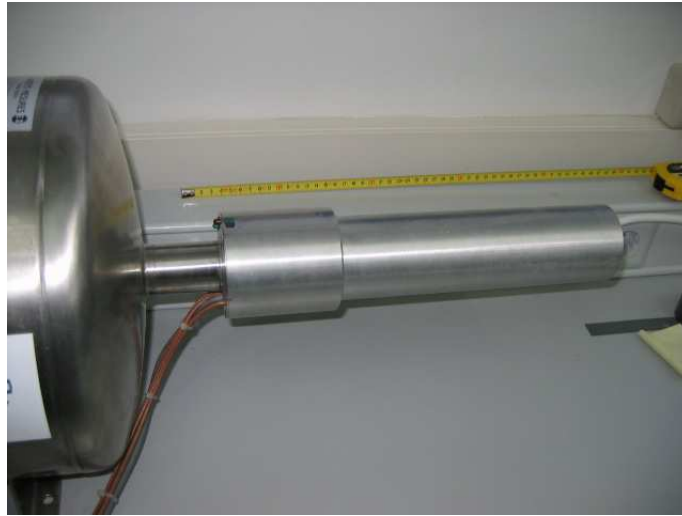
Figura 1. Detector de germanio